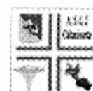
ASP n° 2